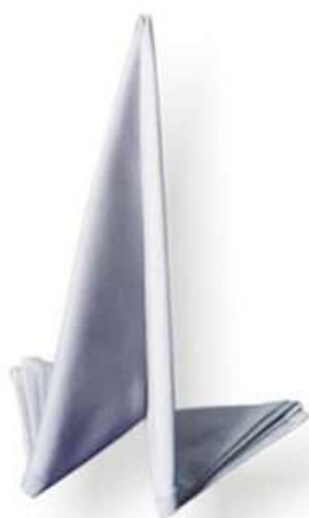
Схема складывания салфетки из ткани для сервировки стола «Эверест»